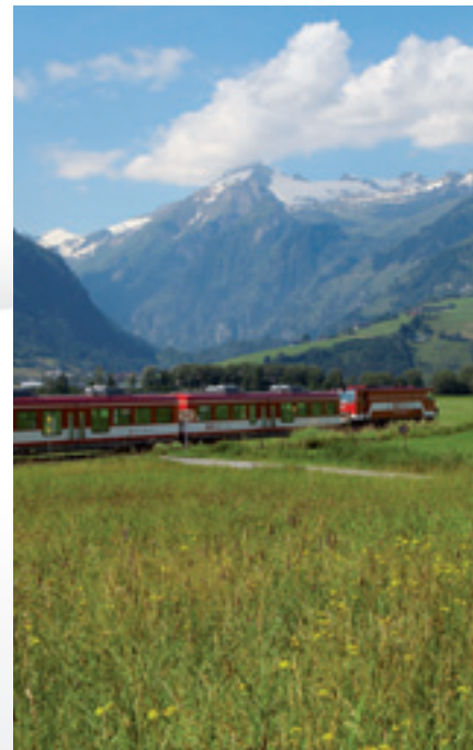
Herausgeber: Ferienregion Nationalpark Hohe Tauern GmbH Gestaltung & Layout: CONECTO Business Communication GmbH Printed in Austria. Druck- & Satzfehler vorbehalten